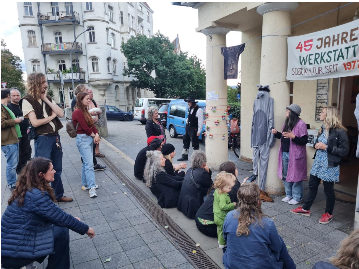
Welkom bij Werkstatt in Kassel tijdens de Documenta