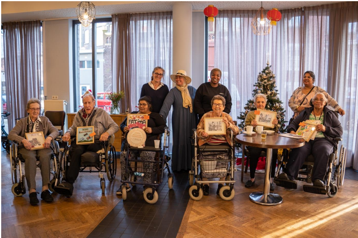
Het wijkmuseum op weg naar verzorgingshuis de Schans (boven), en bij de Schans (onder)