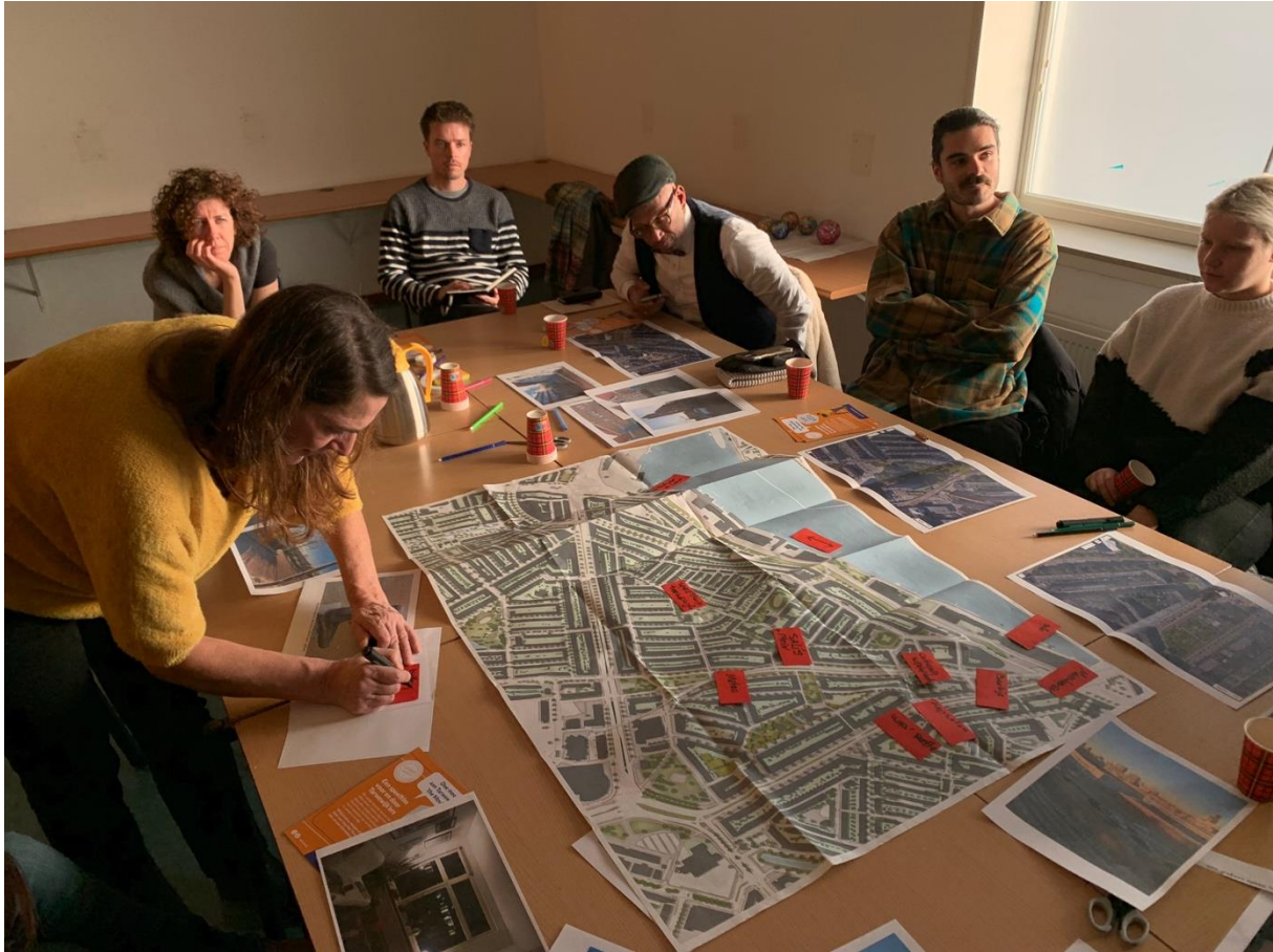
Workshop tbv de Wijkpeelfilm Tarwewijk

Eind 2022 zijn we gestart met een alternatief wijkmuseum in Tarwewijk. In de vorm van een speelfilm brengen we de verhalen van de wijk in beeld. Met bewoners maken we een verhaal én filmen we dit in de vorm van een speelfilm.