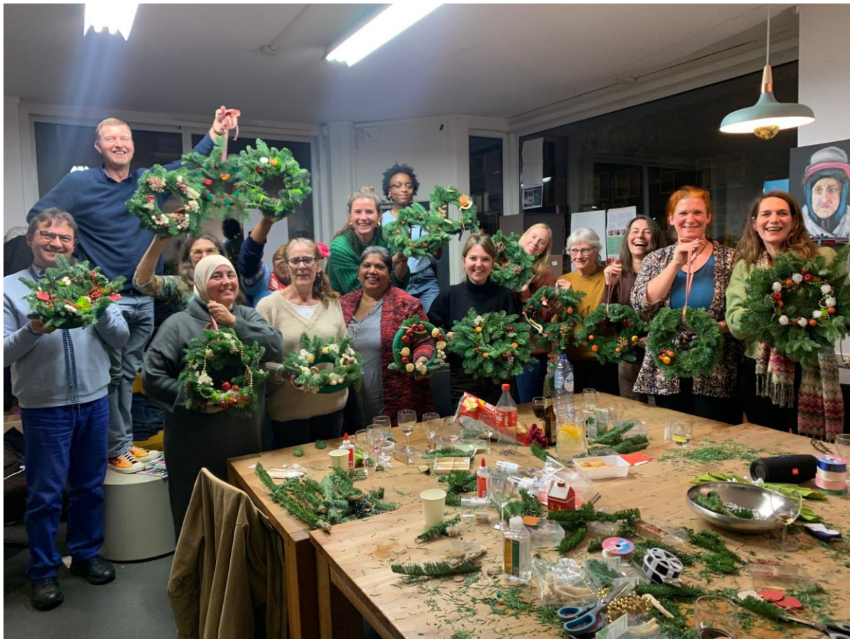
Team met vrijwilligers tijdens een feestdagen-event

medewerkers dragen zorg voor het succesvol uitvoeren van het beleid. De financiële handelingen worden gecontroleerd door een financieel medewerker.