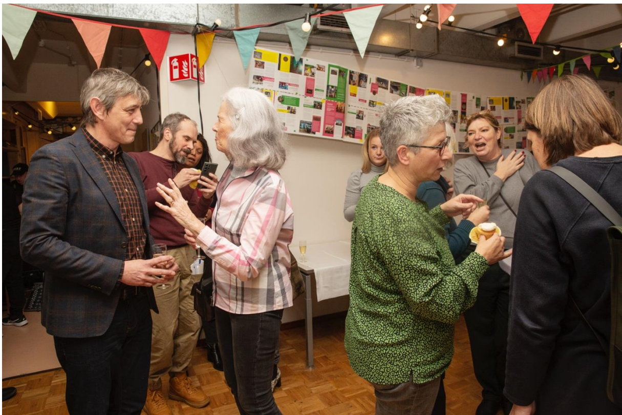
Presentatie Echt Rotterdams Erfgoed Magazine in depot van Museum Rotterdam