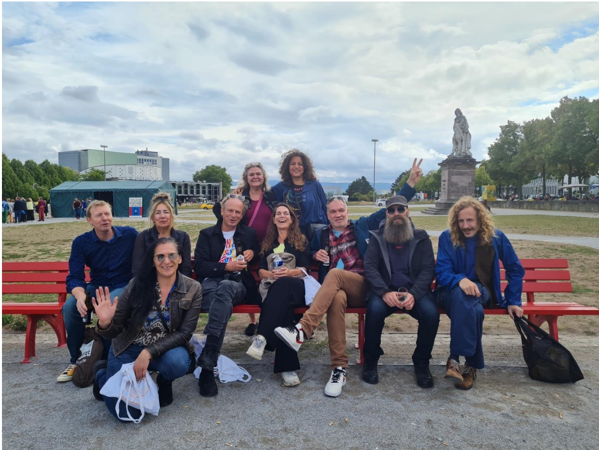
Een deel van de groep tijdens het bezoek aan Documenta