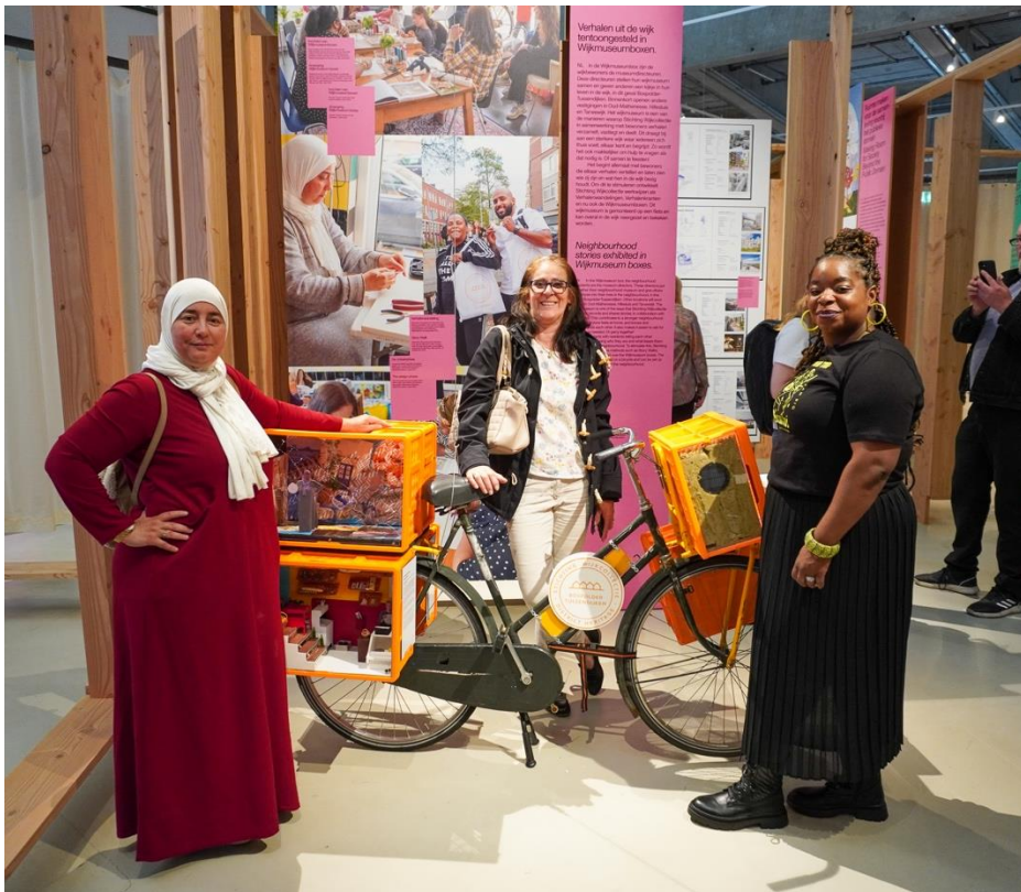
Het mobiele wijkmuseum in het Nieuwe Instituut