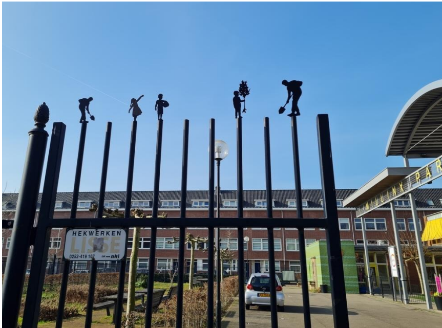
Het voorstel van Marjan Laaper

kunstwerk wordt er een activiteitenprogramma met bewoners ontwikkeld waardoor het hek met het kunstwerk een ontmoetingsplek blijft in de buurt.